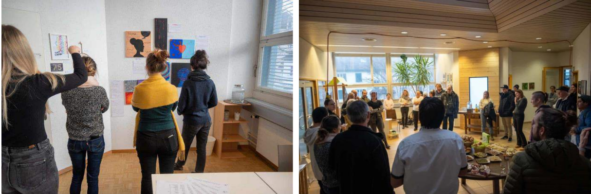
Abbildungen 3 – Vernissage Gruppenausstellung «Kunst im Tripoli»

Am 9. Februar 2023 fand im Arbeitszentrum Tripoli die Vernissage zur ersten Gruppenausstellung «Kunst im Tripoli» statt. Gezeigt wurden Werke von Teilnehmenden und Mitarbeitenden des Arbeitszentrum Tripoli. Abgerundet wurde der Anlass mit einem von Teilnehmenden selbstgemachten Apéro.