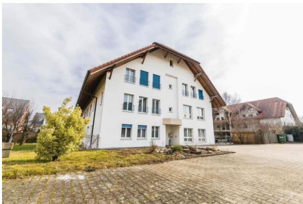
Abbildung 4 - Standort Wohnen Niederbuchsiten

Nachdem Ende 2022 die Wohngruppe Luterbach nach Niederbuchsiten umgezogen ist, fand am 25. März 2023 am neuen Standort der Tag der offenen Tür statt. Die Veranstaltung war gut besucht durch Menschen aus der Nachbarschaft und dem Dorf. Unter den Gästen waren auch Vertreter der Gemeinde Niederbuchsiten.