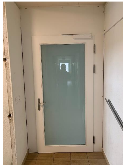
Abbildung 8 - Beispiel einer Brandschutztüre