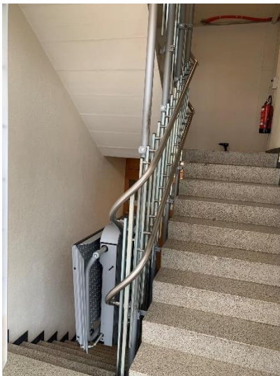
Abbildung 7 - Treppenlift

Gleichzeitig werden im Eingangsbereich alle sanitären Anlagen, die Brandschutztüren ersetzt und das Gebäude mit einer Brandmeldeanlage ausgerüstet.