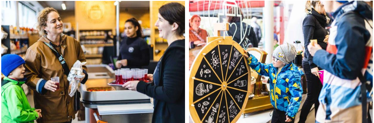
Abbildungen 5 - Jubiläumsfest chlyformat

Am 1. April 2023 feierte der Quartierladen chlyformat sein 3-jähriges Bestehen im Kleinholz in Olten. Trotz des ungünstigen Wetters mit Regen und Wind war die Veranstaltung ein grosser Erfolg, mit einem unerwartet hohen Gästeaufkommen. Ein grosser Dank an unsere treue Kundschaft, welche unsere Arbeit unterstützt und das einzigartige Einkaufserlebnis Tag für Tag mit uns genießt.