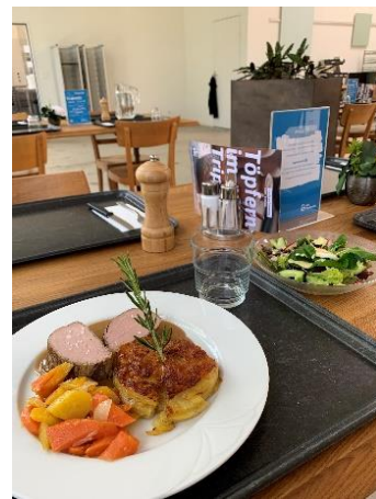
Abbildungen 1 – Einweihung Esspunkt