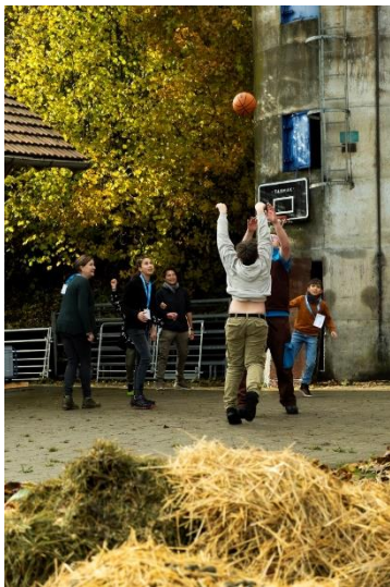
Abbildung 9 - Kinder- und Jugendtage 2023

Die Teilnahme an den Kinder- und Jugendtagen 2023 bot der WG Treffpunkt eine bedeutende Plattform, um die Wichtigkeit und Effektivität ihrer Arbeit einem breiteren Publikum vorzustellen. Durch die engagierte und authentische Präsentation der Kinder und Jugendlichen konnte die WG Treffpunkt ihre Mission und ihre Werte erfolgreich kommunizieren und die öffentliche Wahrnehmung ihrer wichtigen Arbeit im Bereich der Kinder- und Jugendförderung stärken.