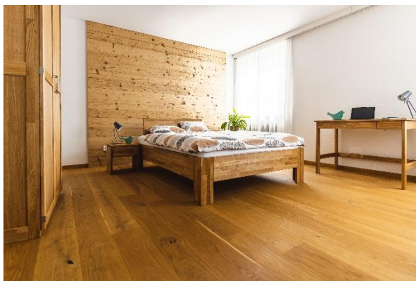
Abbildung 10 - Vorzeigezimmer

Zudem können die Bewohnenden, welche ihre Tagestruktur in der Schreinerei absolvieren, bei der Produktion ihrer Möbel mithelfen.